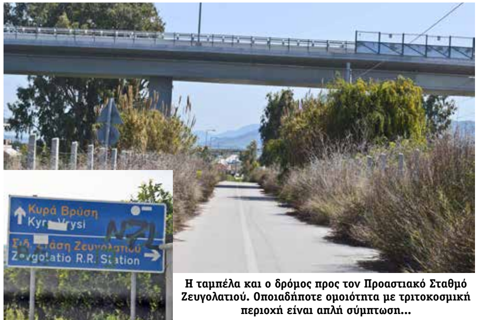
Η ταμπέλα και ο δρόμος προς τον Προαστιακό Σταθμό Ζευγολατιού. Οποιαδήποτε ομοιότητα με τριτοκοσμική περιοχή είναι απλή σύμπτωση...

Στόχος του Συλλόγου είναι να γεμίσει το γήπεδο με τις χαρούμενες φωνές και τα χαμόγελα των παιδιών που μέσα από το παιχνίδι και την διασκέδαση σιγά σιγά να μαθαίνουν αυτό το όμορφο άθλημα. Ο ΓΑΣ Πανμοχαικός καλεί όλους τους φίλους του μικρούς και μεγάλους να παρακολουθήσουν το τουρνουά και να συμμετάσχουν στην χαρά μαζί μας.