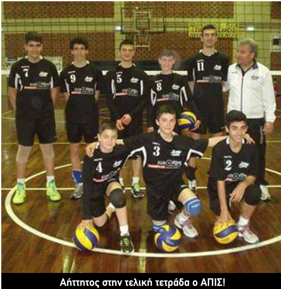
Αήττητος στην τελική τετράδα ο ΑΠΙΣ!