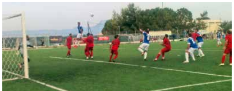
Φάση έξω από τα καρέ της Παναχαϊκής από τους παίκτες του ΑΟΖ

ΠΑΝΑΧΑΪΚΗ (Οφρυδόπουλος): Βρονταράς, Χούσα, Βλάχος, Γκίνο, Μακρυδημήτρης, Ελευθεριάδης, Πολυχρόνης (88' Σούλης), Λουμπραδέας, Φωτάκης, Κωνσταντινίδης (68' Μαστραντωνάκης), Σιαλμάς (63' Μωραϊτή).