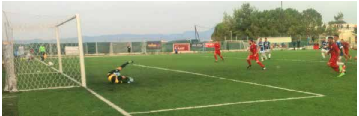
Η πλέον καθοριστική φάση του αγώνα: Ο Φωτάκης έχει εκτελέσει το πέναλτυ και η μπάλα μόλις έχει ξεφύγει από τα χέρια του Τσέλιου για να καταλήξει στα δίχτυα γράφοντας το 0-1.

διαμορφώνοντας με τον τρόπο αυτό το τελικό αποτέλεσμα του αγώνα.