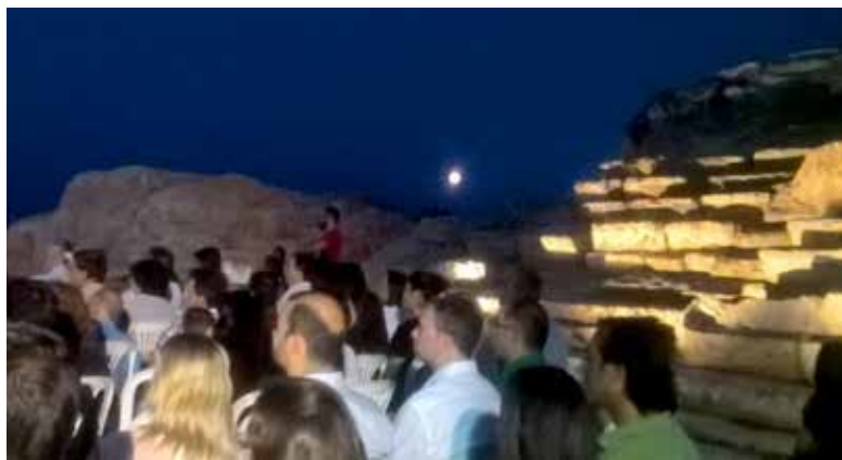
Κάτω: Το φεγγάρι ολόγιομο προέβαλε ολόφωτο πίσω από το αρχαίο θέατρο κλέβοντας την παράσταση!

σελκύσουμε κι άλλες πηγές χρηματοδότησης. Σ' αυτό το πλαίσιο πρέπει να σημειώσουμε την άμεση ανταπόκριση