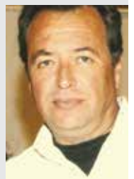
Γράφει ο ΜΑΚΗΣ ΝΙΚΟΛΑΟΥ Αγρότης