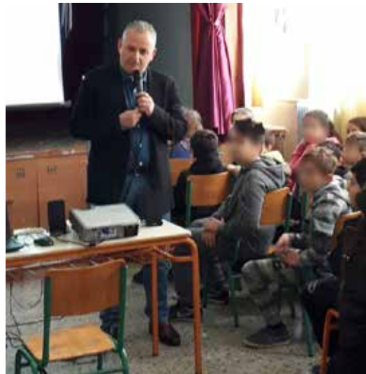
Ο δήμαρχος Βέλου-Βόχας Αννίβας Παπακυριάκος εξηγεί στους μικρούς μαθητές του 1ου δημοτικού σχολείου Ζευγολατιού την σημασία της ανακύκλωσης

Όπως αναφέρει χαρακτηριστικά ο Αντιδήμαρχος