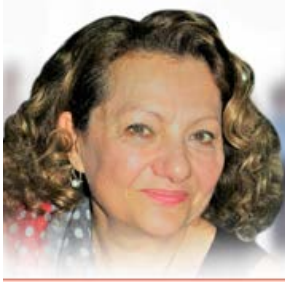
Γράφει η Ευαγγελία Πανούση*

Είναι γεγονός ότι ζούμε σε δύσκολους και χαλεπούς καιρούς. Η καθημερινότητα μας έχει γίνει πια ακαθόριστη και περισσότερο ανασφαλής από άλλοτε.