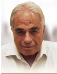
Γράφει ο Γιώργος Αντωνόπουλος*

Θέλουμε έναν Δήμο στην υπηρεσία του πολίτη ή ένα Δήμο υπηρέτη ατομικών & οικονομικών συμφερόντων;